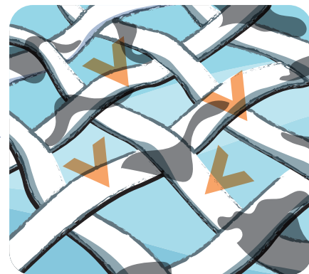
Čiastočky sa ľahšie odstránia pomocou iných zložiek