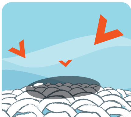
Enzymy pôsobia na škvŕny

Vysoko účinné zložky, ktoré zabezpečia výnimočné odstraňovanie škvŕn a čistenie tých najodolnejších škvŕn po profesionálnom použití.